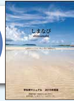
「しまなび」プログラム実施マニュアル(本学作成)