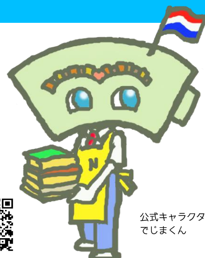
公式キャラクター てじまくん